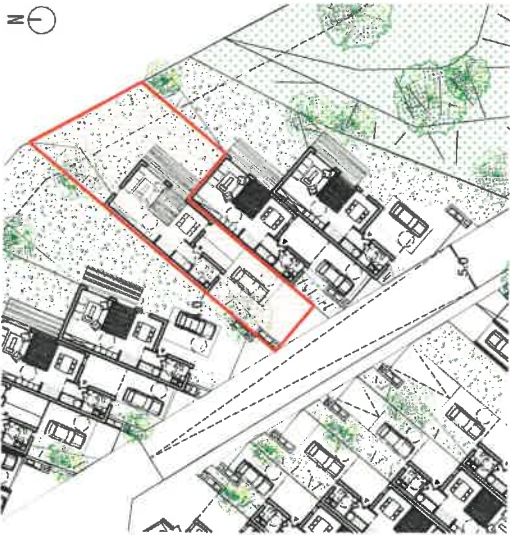
TABEAU DE SURFACES