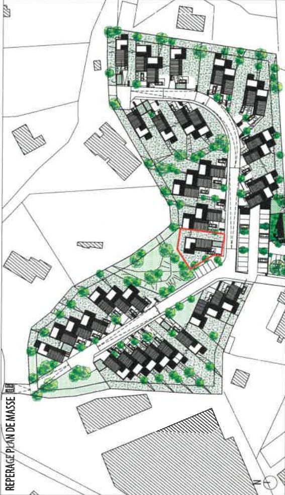
LOCALISATION - PLAN DE REPERAGE