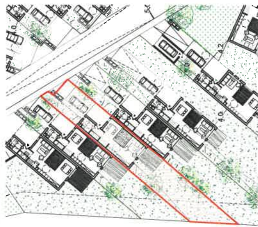
TABEAU DE SURFACES