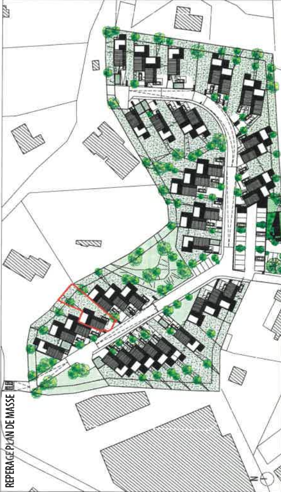
LOCALISATION - PLAN DE REPERAGE